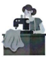
กลุ่มอาชีพหรือกลุ่ม ผลิตภัณฑ์ท้องถิ่น (เช่น OTOP)