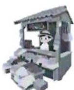
กลุ่มผู้ประกอบการ ชุมชน / วิสาหกิจชุมชน