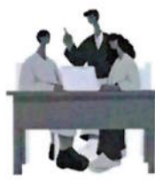
ผู้นำชุมชน / คณะ กรรมการหมู่บ้าน