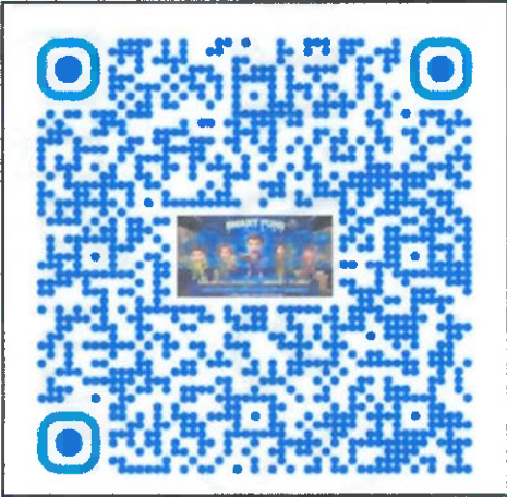
QR Code แบบประเมินความพึงพอใจ

หมายเหตุ: ขอความร่วมมือสำนักงานพัฒนาชุมชนจังหวัด/สำนักงานพัฒนาชุมชนอำเภอ ประชาสัมพันธ์ เผยแพร่เครื่องมือแอปพลิเคชัน “นวัตกรรม SMART FUN(D)” ประกอบด้วย ๑) Dashboard SMART FUN(D) ๒) AI Chatbot : น้อง FUN(D) ๓) สื่อ Edutainment HERO Content / คลิปสั้น และประเมินความพึงพอใจ ร่วมให้ข้อเสนอแนะเพื่อการพัฒนางานทุนชุมชนในอนาคต โดยสแกน “QR Code แบบประเมินความพึงพอใจ” ด้านล่าง ภายในวันที่ ๑๕ พฤษภาคม ๒๕๖๕