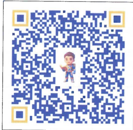
QR Code เข้าใช้งาน Dashboard SMART FUN(D)