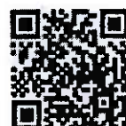
คู่มือการบริหารจัดการฯ