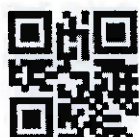
ข้อมูลโครงการฯ

ที่มาของข้อมูล : คู่มือการบริหารจัดการโครงการอันเนื่องมาจากพระราชดำริเชิงพื้นที่ด้วยกระบวนการ One Plan ( https://share.google/EJYJr5MWaAxyzSF1L )