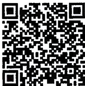
โปสเตอร์ประชาสัมพันธ์โครงการ