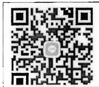
กลุ่มไลน์ "โครงการพัฒนาคุณภาพชีวิต"